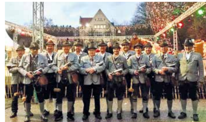
Die Griesstätter Böllerschützen bei der Eröffnung des Wasserburger Christkindlmarktes.

Auch heuer hatten die Griesstätter wieder die Ehre, den Beginn des Christkindlmarktes Wasserburg am 24.11.2023 mit mehreren Salven aus ihren Handböllern lautstark anzukündigen. War es an den Tagen vorher noch trocken und sonnig, so begann an diesem Tag der Winter mit Schnee, Regen und Wind. Das konnte die sturmerprobten Böllerschützen aber nicht aufhalten. Als sie sich am Gries zum Schießen aufstellten, war es zum Glück kurze Zeit trocken. Als kleine Anerkennung bekam jeder einen Gutschein für eine Brotzeit an den Marktständen.