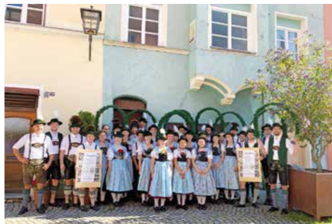
Gruppenbild der Griesstätter und Wasserburger Trachtler vor dem Geburtshaus von Franz Xaver Huber, dem Gründer des Gauverbandes I.

Es wäre schön, wenn diese Veranstaltung im Frühjahr als Zeichen zum Aufbruch in ein neues Jahr wiederholt werden könnte. Text: Josef Furtner; Fotos: Inge Erb, Sylvia Peter