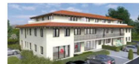
Alpenstraße 25 - Tel: 08039 909 63 70 - alpen-apo@web.de

Liebe Griesstätterinnen, liebe Griesstätter,