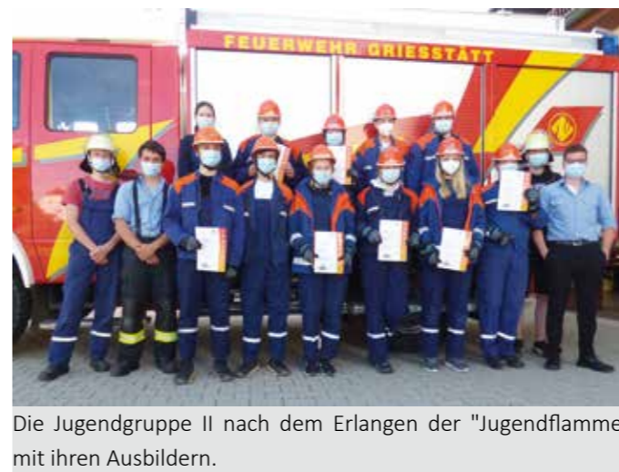
Die Jugendgruppe II nach dem Erlangen der "Jugendflamme" mit ihren Ausbildern.

Bleibt so fleißig und aktiv bei der Feuerwehr - wir freuen uns auf Eure weitere Ausbildung!