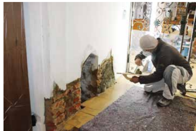
Das Foto entstand bei den Arbeiten am Haupteingang, wo die schadhaften Putzflächen kleinflächig ausgetauscht wurden.

Damit ist aber längst nicht Schluss für die Kirchenverwaltung. Die Erhaltung eines solchen Bauwerks erfordert viel Liebe zum Detail und eine generationenübergreifende Ausdauer, die hoffentlich auch in Zukunft Bestand hat.