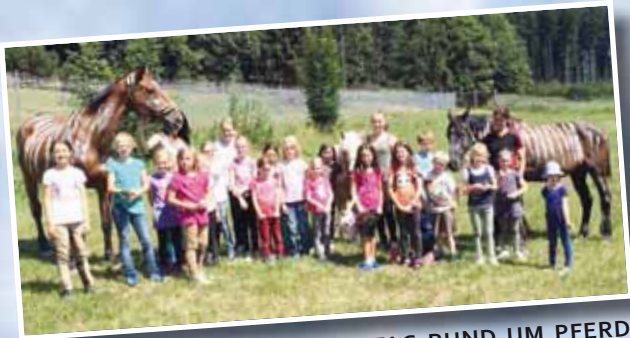
▲ Auch beim zweiten ERLEBNISTAG RUND UM PFERD in Kornau lernten die Kinder das Basiswissen mit dem Umgang der Tiere. Nach dem Reiten wurden die Pferde in „Zebras“ (keine Angst, es war ein natürlicher Schutz, welcher hier verwendet wurde) verwandelt; das hatte allen noch extra viel Spaß gemacht.