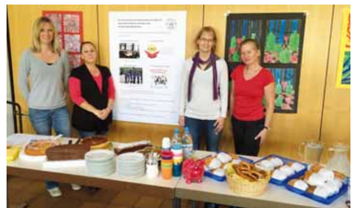
Text/ Foto: Marcus Wehner