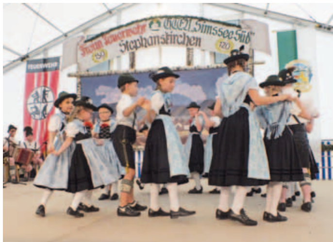
Auftritt der Griesstätter Trachtenjugend auf der Tanzbühne im Festzelt.

Am Christi-Himmelfahrtstag fand auf Anregung der Stephanskirchner Trachtler der Gebietsjugendtag zusammen mit einem Trachten- und Handwerkermarkt statt. Den Rahmen bildete das 120-jährige Gründungsfest, das der Trachtenvereins Simssee-Süd zusammen mit dem 150-jährigen Jubiläum der Freiwilligen Feuerwehr Stephanskirchen begann. Zu diesem Zweck wurde witterungsbedingt neben der Tanzbühne im Festzelt eine Musikbühne in die Garage einer Schreinerei verlegt und für gute Stimmung davor ein Pavillon aufgebaut. Die Mitglieder des Festvereins zeigten in einer angrenzenden Wiese verschiedene Möglichkeiten der historischen Heuernte. Außerdem arbeiteten u.a. ein Federkielsticker und ein Kunstschmied an neuen Werkstücken. Natürlich waren auch die Griesstätter Trachtenkinder eifrig zugegen. Als gegen Abend die 14 Gebietsvereine ihre Auftritte und Darbietungen im Festzelt und auf der Musikantenbühne abgeschlossen hatten, fand der Tag bei einem Tanzmusiktreffen mit 4 Gruppen einen klangvollen Abschluss.