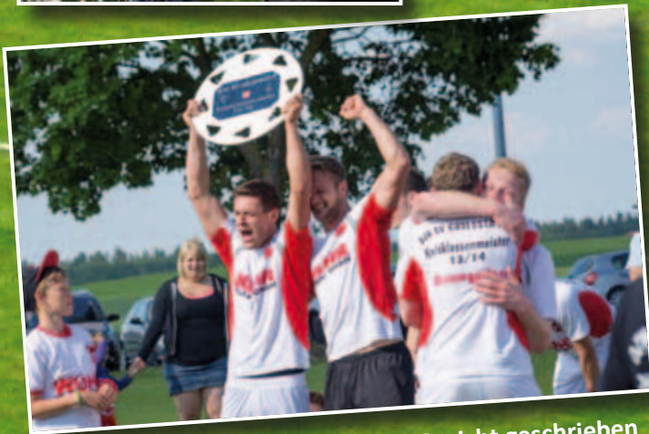
↑ Die Erleichterung ist jedem ins Gesicht geschrieben