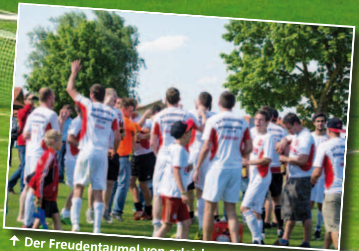
↑ Der Freudentaumel von erleichterten Spielern und Fans