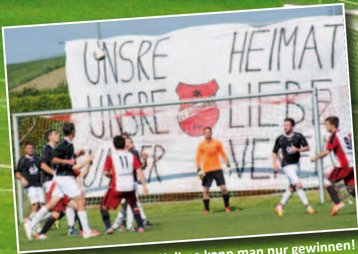
↑ Vor dieser Kulisse kann man nur gewinnen!